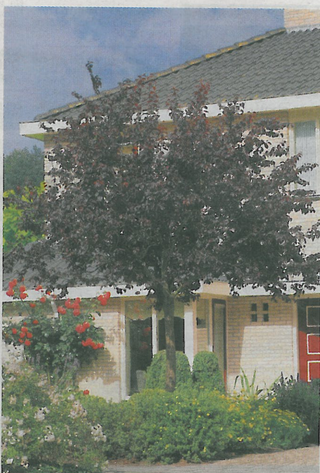
Stads: Deze roodbladige esdoorn groeit minder snel en is een verstandiger keus voor een kleine plek. Bovendien doet donkerrood het goed temidden van het andere groen.

Wie een boom wil planten, moet zich haasten – of wachten tot de herfst.