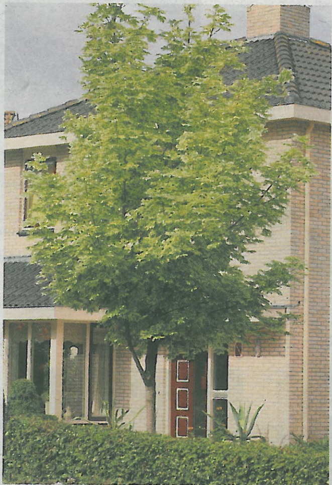
Parkboom: Een Noorse esdoorn ( Acer platanoides ) in een voortuin is niet een heel goed idee, want de boom kan uitgroeien tot een gevaarte van 30 meter hoog.

Een bezoek aan De Limieten is hoe dan ook een goed begin voor een zoektocht naar een boom, omdat hier bijzondere bomen in hun volgroeide gedaante zijn te bewonderen. Rond deze tijd van het jaar zijn de groenblijvers de blikvangers. Behalve volgroeide bomen heeft De Limieten ook volgroeide hagen en heesters. En je kunt hier terecht met je vragen en twijfels. De deskundigheid is groot en de bereidheid om die te delen ook. Grote kans dus dat de zoektocht naar een boom bij deze kwekerij eindigt.